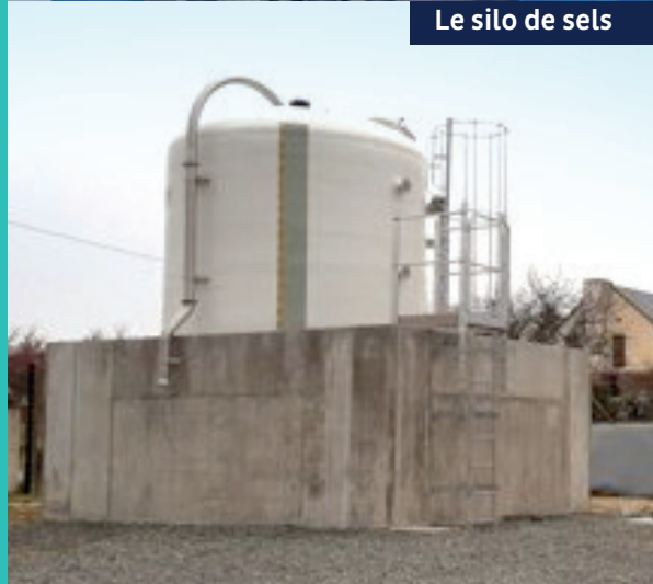
Le silo de sels