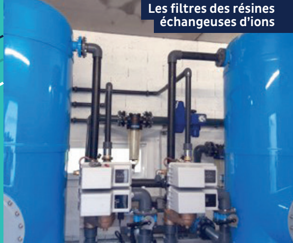
Les filtres des résines échangeuses d'ions

Le fonctionnement de l'adoucisseur permettra de diminuer la dureté sur les 4 communes entre 12 et 23 °F.