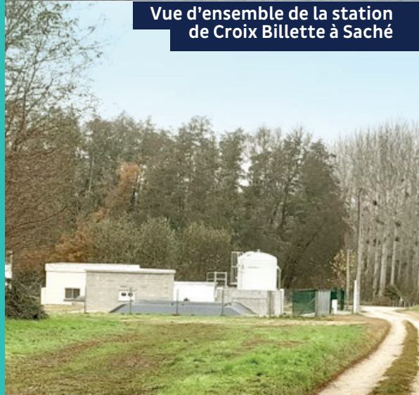
Vue d'ensemble de la station de Croix Billette à Saché